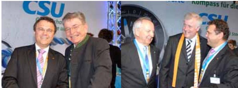
Dr. Hans-Peter Friedrich mit dem Sprecher der CSK, Dr. Thomas Goppel, sowie dem EAK-Vorsitzenden Dr. Ingo Friedrich und Parteichef Horst Seehofer

der Diskussion über eine nachhaltige Energiestrategie betonte der CSU-Landesgruppenvorsitzende etwa die Notwendigkeit eines Energie-Dreisprungs aus Energiesparen, Energieeffizienz und Ausbau erneuerbarer