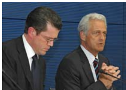
v.l.n.r.: Dr. Karl-Theodor zu Guttenberg und Dr. Peter Ramsauer

Banken nicht in Form sonst notwendiger Wertabschreibungen belasten. Solche Bilanzbelastungen würden