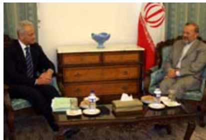
Dr. Peter Ramsauer und der iranische Außenminister Mottaki

eigenen Versorgung mit Kernenergie. Solange der Iran aber Zweifel an seiner Aufrichtigkeit zulasse, der Internationalen Atomenergiebehörde nicht jederzeit Zugang zu allen Anlagen erlaube und mit der aggressiven Polemik