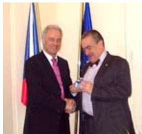
Dr. Peter Ramsauer zu Besuch beim tschechischen Außenminister Fürst Schwarzenberg

aktuelle bilaterale und internationale Fragen. Insbesondere der westliche Balkan und die Situation im Kosovo waren Gegenstand der Gespräche. Beide Gesprächspartner waren sich