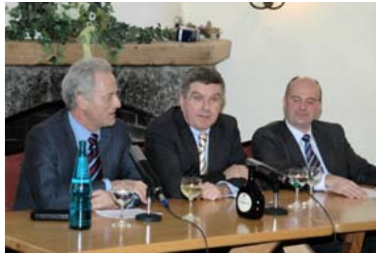
v.l.n.r.: Dr. Peter Ramsauer, Dr. Thomas Bach und Hartmut Koschyk

Jugendlicher sei der Verweis auf die integrative Kraft des Sports heute von eminenter Bedeutung.