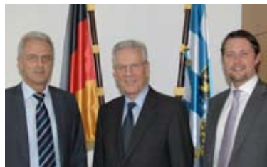
v.l. Dr. Peter Ramsauer, Dr. Volker Hauff und Dr. Andreas Scheuer

einem gesamtpolitischen Ordnungsprinzip weiterentwickelt.