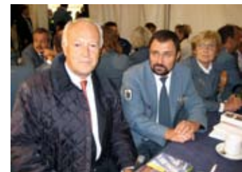
Dr. Hans-Peter Uhl am „Bayerntisch“