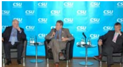
Peter D. Sutherland, Michael Glos und Dr. Martin Bartenstein

Großen Koalition würden mehr und mehr in die ökonomische Substanz hineinwachsen. „Endlich ist mit Bundeswirtschaftsminister Glos wieder eine klare Handschrift einer zukunftsfähigen, erfolgreichen